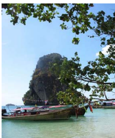
Krabis vackra landskap med magnifika kalkstensklippor som stiger upp ur havet är lockande för Thailandresenären.